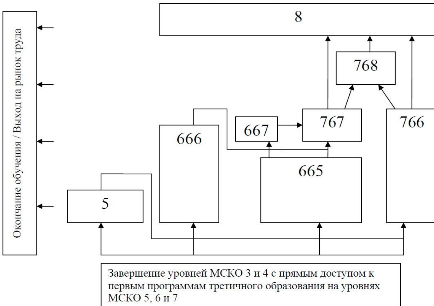
Схема 1. Пути перехода третичного образования в рамках МСКО